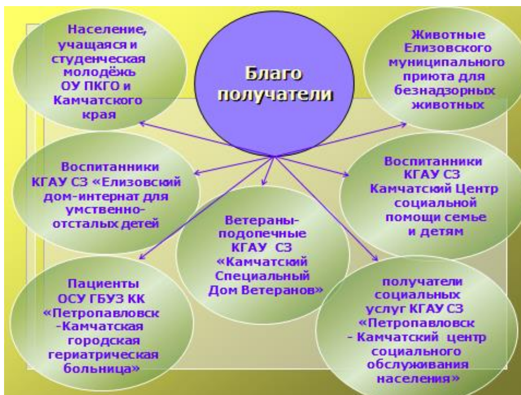
Рис. 4 Целевая группа благополучателей

регионального этапа Всероссийского конкурса «Доброволец России-2017» в номинации «Волонтерство в медицине».