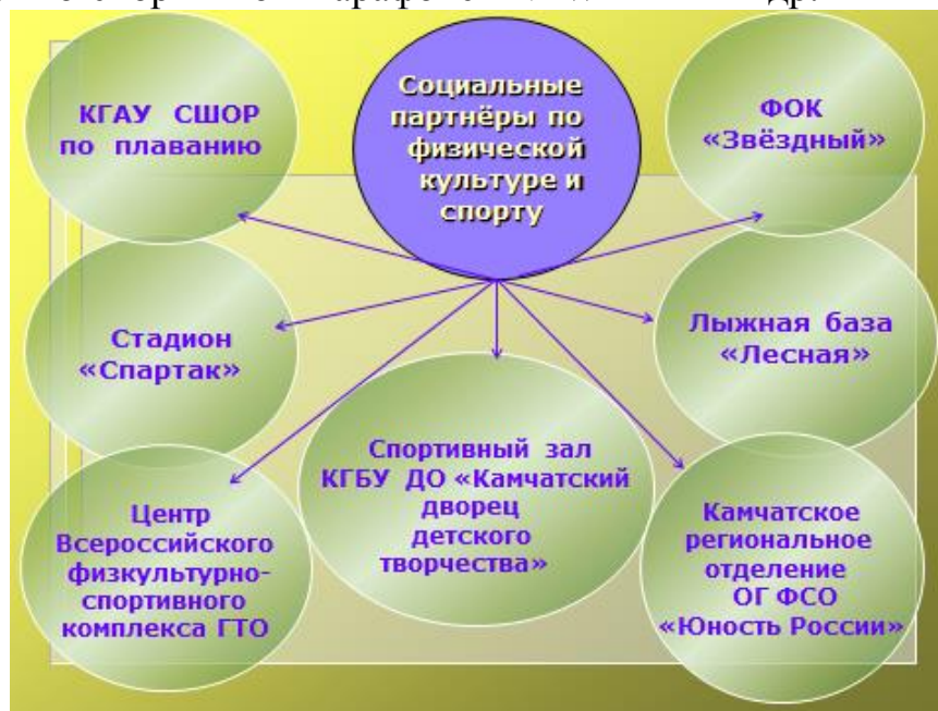
Рис 6. Физкультурно-спортивная среда

Так, для обучающихся и сотрудников колледжа организовано посещение плавательного бассейна, студенты принимают активное участие в спортивно-оздоровительных акциях, мероприятиях: Всероссийской спартакиаде по военно-спортивному многоборью «Призывники России», акциях «День здоровья», «День бега», «Лыжня России», «Кросс наций», патриотической «Эстафете мира», посвящённой Дню победы 9 мая, Краевом легкоатлетическом кроссе среди учащихся ОУ ПО, Спартакиаде Камчатского края по лёгкой атлетике, ежегодной Краевой выставке «Медицина. Здоровье. Красота», в краевом танцевально-спортивном марафоне «NEW LIFE» и др.