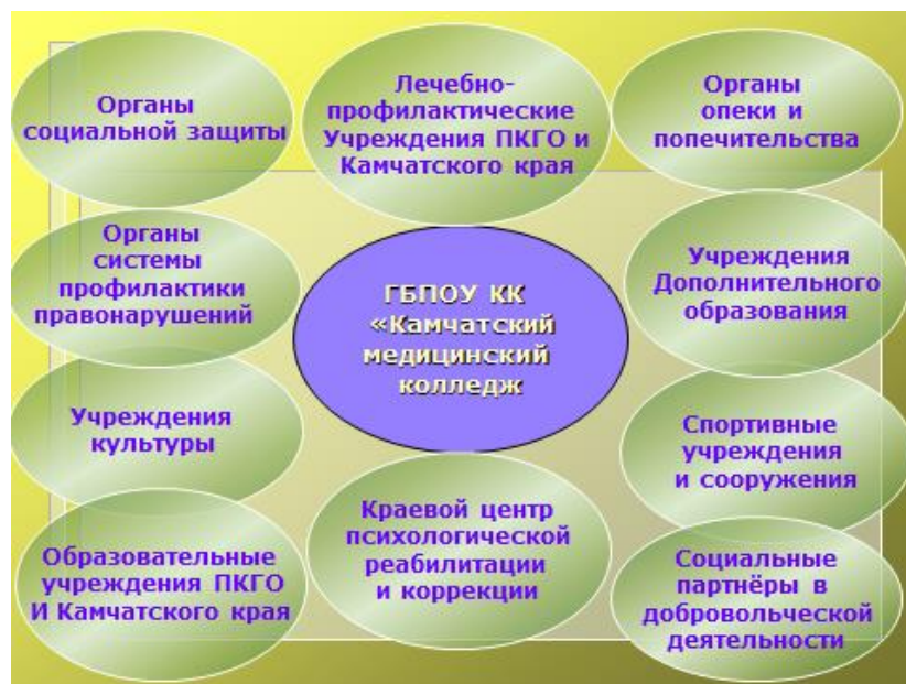
Рис 1. Социальное партнёрство

Одним из способов эффективности и целенаправленности воспитательных влияний социокультурной среды колледжа является педагогическое моделирование этой среды, компонентами которой являются: