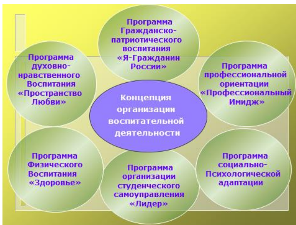
Рис. 2 Программно-целевое обеспечение воспитательной деятельности

В качестве главной содержательной идеи Концепции рассматривается создание воспитательной системы, способной привести к максимальным результатам воспитательной работы, достижению целей всех участников воспитательного процесса в условиях целостного образовательного процесса, при управляющем воздействии социокультурной среды и сформированной профессиональной мотивации студентов.