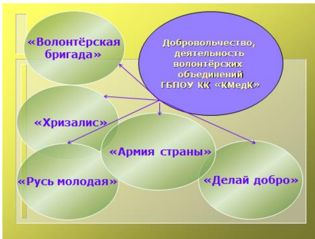
Рис 3. Студенческие объединения волонтеров ГБПОУ КК «КМедК»

организация праздников, образовательных и творческих мероприятий.