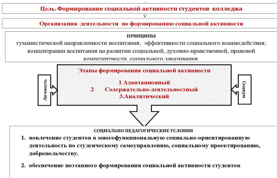
Рис 5. Модель формирования социальной активности

Социальное проектирование духовно-нравственной и гражданско-патриотической направленности не только содействует становлению, развитию и воспитанию в будущем медицинском работнике таких его личностных качеств, как совесть, ответственность, добро и справедливость, но и формирует мотивацию успеха, развивает способность к социальному сотрудничеству, позволяет достичь позитивных результатов в коллективном творчестве. Подобная форма социального воспитания студентов обеспечивает использование огромного потенциала студенческой молодежи, помогает студентам колледжа чувствовать себя нужными и востребованными. Участники социальных проектов совместно решают социально значимые задачи, реализуя основную идею служения людям.